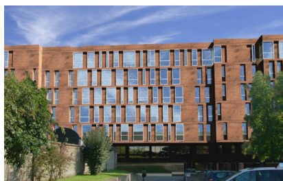
Nuova RSA Via Fornari